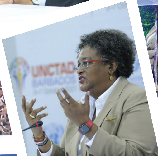
World Leaders Summit, Dialogue 3