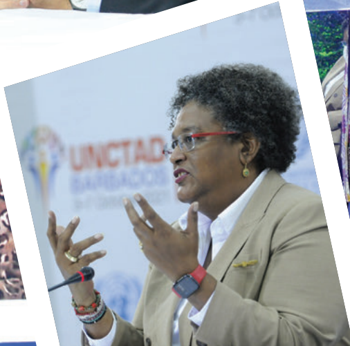
World Leaders Summit, Dialogue 3